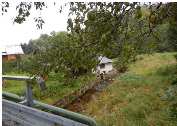
Pohled z mostku po vodě