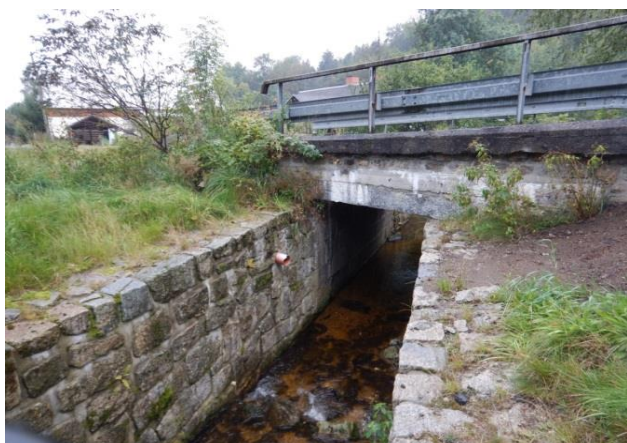
Mostek nad tokem v místě KB

Most přes přítok Jeřice, který nemusí být kapacitní. Cca 100 m po proudu přítok ústí do Jeřice, kde se spolupodílí na povodňovém ohrožení v lokalitě Na Pilách.